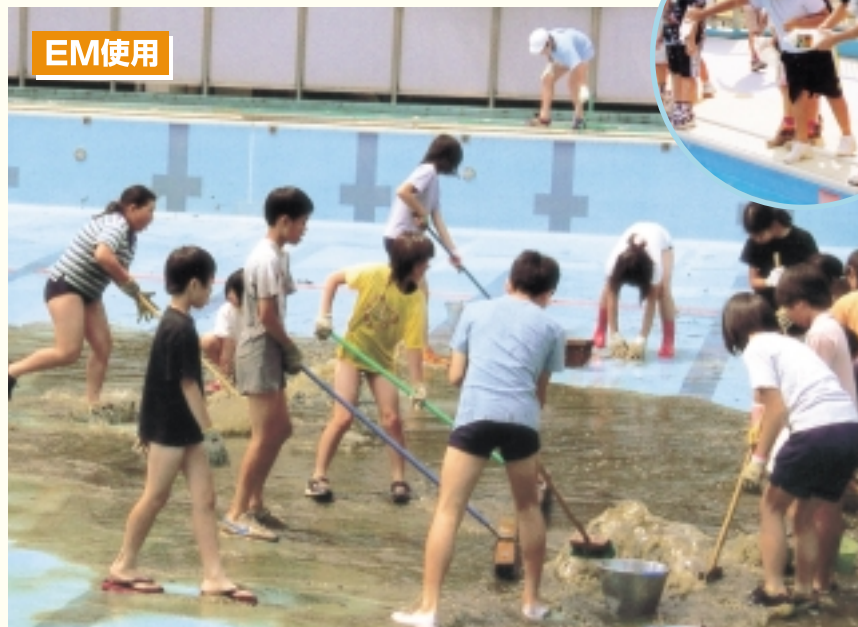
素足でも滑らないので安全! 汚れがあつという間に流れていった。

EMを投入しておいたプールの大量の水は、河川に流れてやがては海に達します。EMはその流れの中で増え続け、河川や海を浄化する力を発揮します。