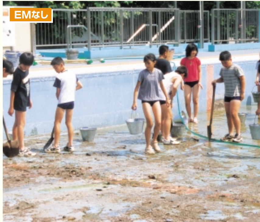
ヌメリに足をとられて危ない! ヘドロが臭い!