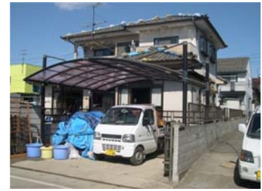
へドロが比較的小さいお宅は床板の上から EM 散布(多賀城市)