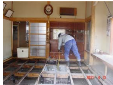
部屋毎に丁寧に EM 散布&洗浄