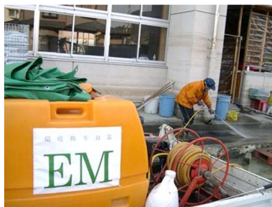
避難所（湊中学校）の周辺を EM 洗浄

午前中は東北 EM 普及協会の関係者（F 社）の方と今後の打ち合わせをしました。EM 散布に行ってほしいリストをいただき、今後はそれにもとづいてまわりたいと思います。また、石巻市の自衛隊員と EM 散布についての話をしてきました。