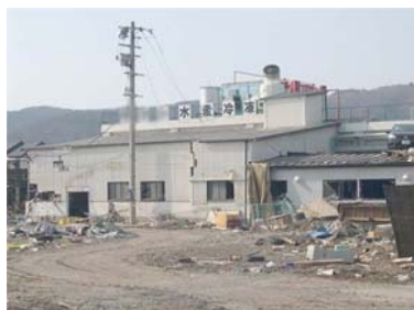
水産物加工会社も多く被災