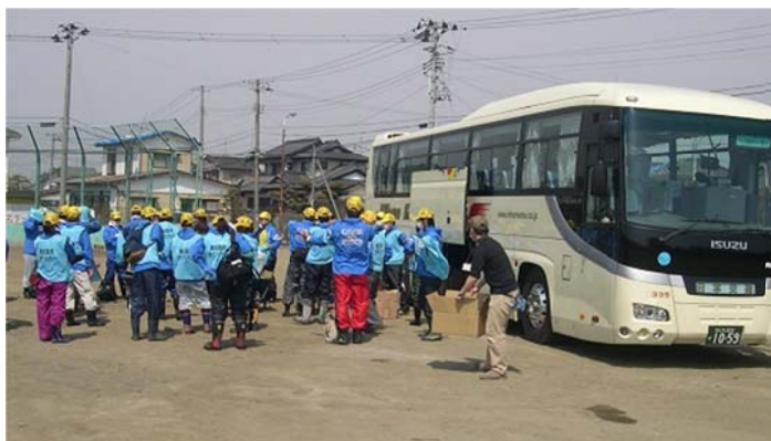
シャトルバスで現地入りする泥かきボランティア