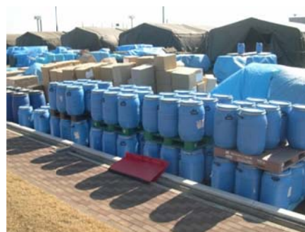
4 トンの EM ボカシ