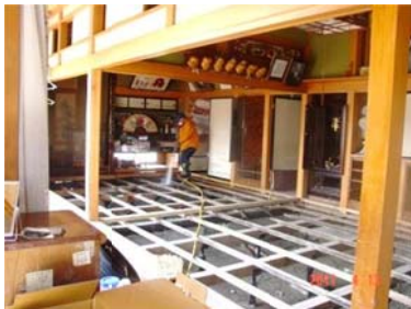
泥かき後の床下に EM 散布

床下の臭いは何度か確認していく必要があります。本日散布した9軒も後々フォロー予定です。