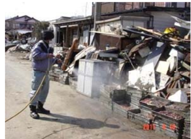
腐敗臭を放つ海産物にも散布