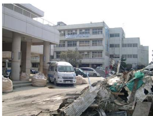
海岸に近い湊中学校

石巻は家の中が片付いていないところがまだまだあるので状況を見ながら進めていきたいです。