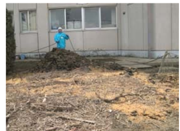
かき出したヘドロに EM 処理 (赤井南小学校:宮城県東松島市)

次に石巻市役所の水産課を訪ね、水産物やヘドロ、トイレの悪臭に EM 散布の効果について話をしました。岩手日報で、大船渡市が、被災水産物 15000 トンを EM を混ぜて埋めるとの記事が掲載されていたことも紹介しました。