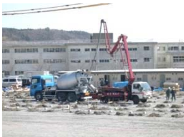
急ピッチで建設中の仮設住宅