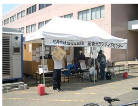
石巻災害ボランティアセンター (石巻災害復興支援協議会)